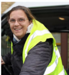
Els Chauffeur minibus en logistieke hulp